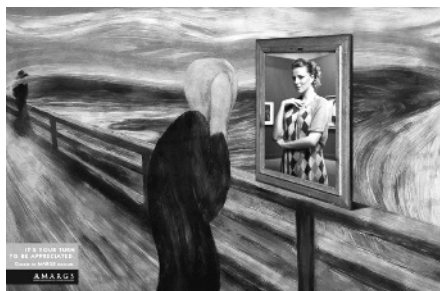
Figuras 3 y 4: Publicidad del Museo Margs (Porto Alegre, Brasil) y campaña navideña de museos romanos.

La campaña de la agencia DCS Porto Alegre (figura 3) mostró obras modificadas de Lichtenstein Botero y Munch, en las cuales primaba el retrato enmarcado de personas reales, señalando que el público era el factor vital de todo museo (Mena, 2016: 108). Esto recuerda toda la apropiación que se le hace al arte, de cómo la publicidad se ayuda o se apropia del arte para crear y (se quiera o no) el hecho de versionar o manipular una obra de arte, como tantas veces se ha hecho con la Gioconda de Leonardo da Vinci.