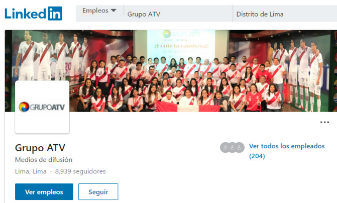
Figura 5 Perfil corporativo de ATV

Nota: Cuenta oficial de LinkedIn de ATV (13/IV/2019).