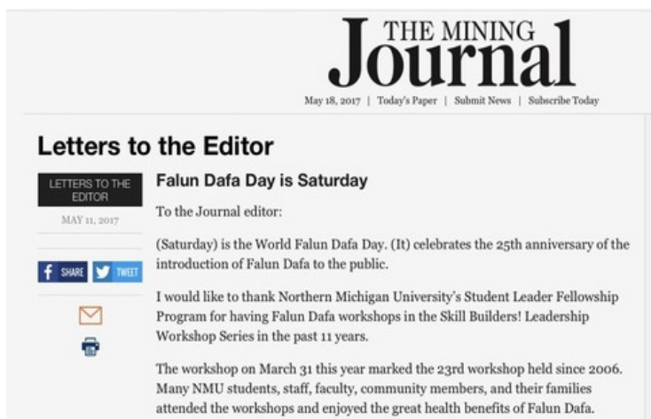
Figura 1 Ejemplo de carta al editor

Nota: Portal de The Mining Journal (18/V/2017).