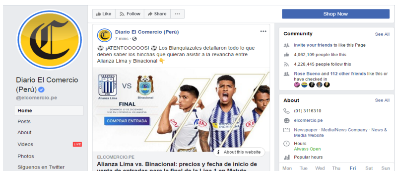
Figura 3 Muro de publicaciones del diario El Comercio

Nota: Cuenta oficial de Facebook del diario El Comercio (3/IV/2019).