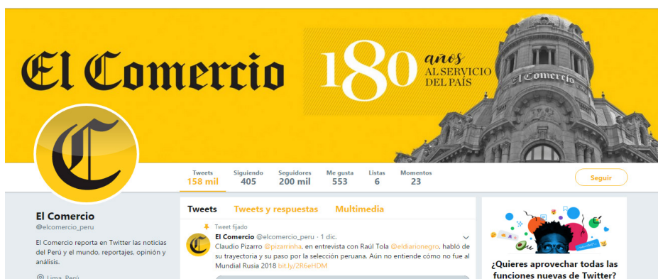
Figura 6 Tweets del diario El Comercio

Nota: Cuenta oficial de Twitter del diario El Comercio (13/IV/2019).