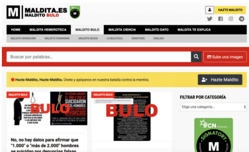
Figura 10 Página web dedicada a identificar bulos informativos

Nota: Portal electrónico de BULO (10/V/2019).