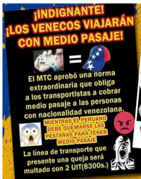
Figura 9 Información falsa acerca de medio pasaje para los venezolanos

Nota: Cuenta oficial de Facebook de “El Perú primero” (16/V/2019).